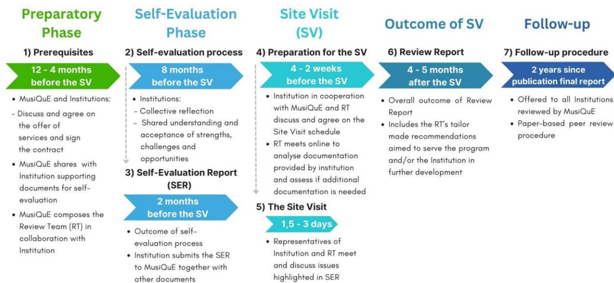
Рис.1 Этапы и хронология процедуры регулярного обзора MusiQuE